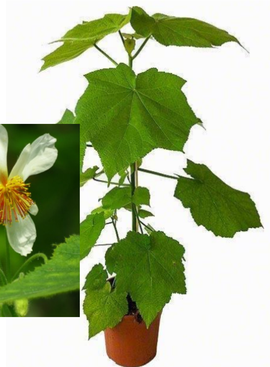
Hygrofyt met fluwelige blad (haartjes) Bijv. Gynura, Platycerium, Sparmannia